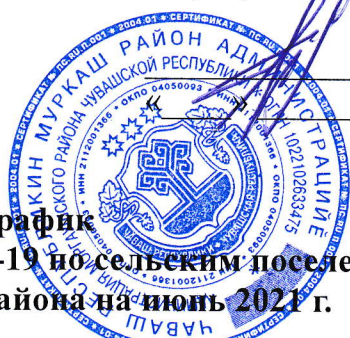
График вакцинации от COVID-19 по сельским поселениям Моргаушского района на июнь 2021 г.